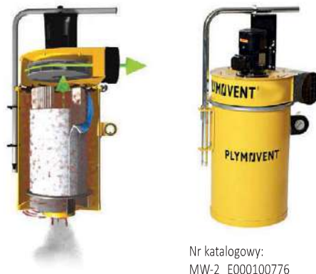
Nr katalogowy: MW-2 E000100776